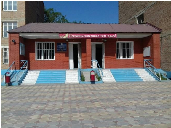
главный учебный корпус -