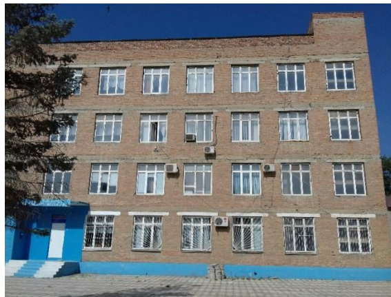
1 учебный корпус